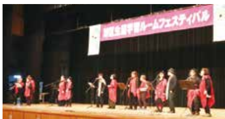
▲舞台発表のようす

区内小学校で開講している生涯学習ルームの学習成果を発表します。 皆さまのお越しをお待ちしています!