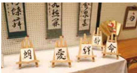
▲作品展示のようす