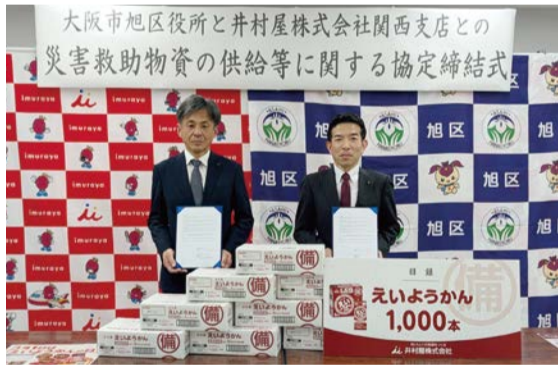
▲井村屋株式会社 川崎取締役様(左)と福岡区長