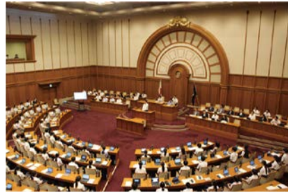
昨年の様子(市会議場で開催)

議員になって、市長に質問や提案をしてみませんか。対象は市内在住または在学の小学5・6年生。定員81人。