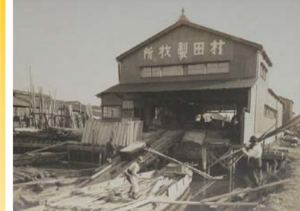
村田製材所(写真展示) 大正期

鉄工所や製材所、硝子加工所など、大阪ゆかりの町工場に関する大正時代から昭和時代までの資料を中心に展示。現在の暮らしに身近なものづくりの歴史を紹介しします。