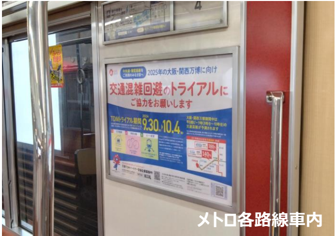
メトロ各路線車内