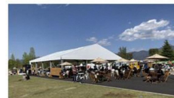
写真・イラストは、現時点のイメージ