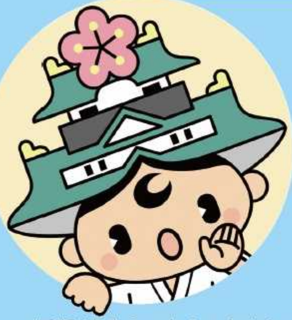
中央区マスコットキャラクター ゆめまるくん