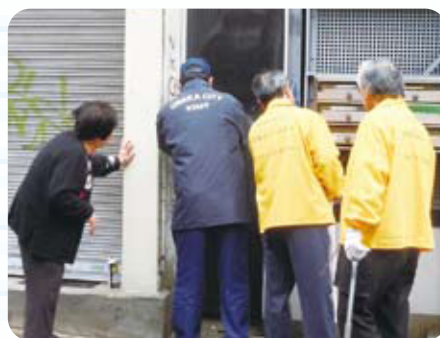
落書き消去活動の様子