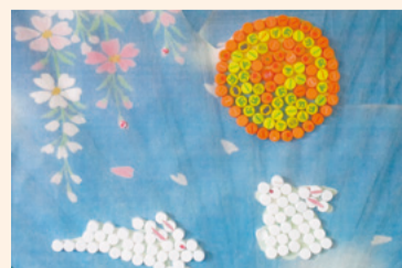
ボランティアで作成したキャップ作品

とき 3月27日(土) 13:30～15:30 内容 エコキャップの分別、キャップで作品をつくろう! ところ 中央区社会福祉協議会(中央区上本町西2-5-25) 対象 子どもから大人まで興味のある方どなたでも 定員 6名(要申込・先着順) 締切り 3月19日(金)