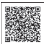
中央区公式 YouTubeチャンネル

中央区では、「映像で振り返る1970年大阪万博」と題し、EXPO'70に向けた当時の大阪市の映像を区役所1階ロビーで放映しています!中央区公式YouTubeチャンネルでも配信していますので、ぜひご覧ください。