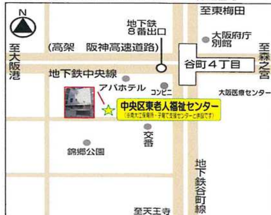
【大阪市立中央区東老人福祉センター 付近図】