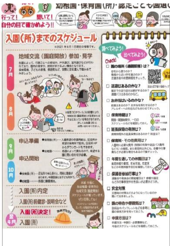
3 ページ目イメージ