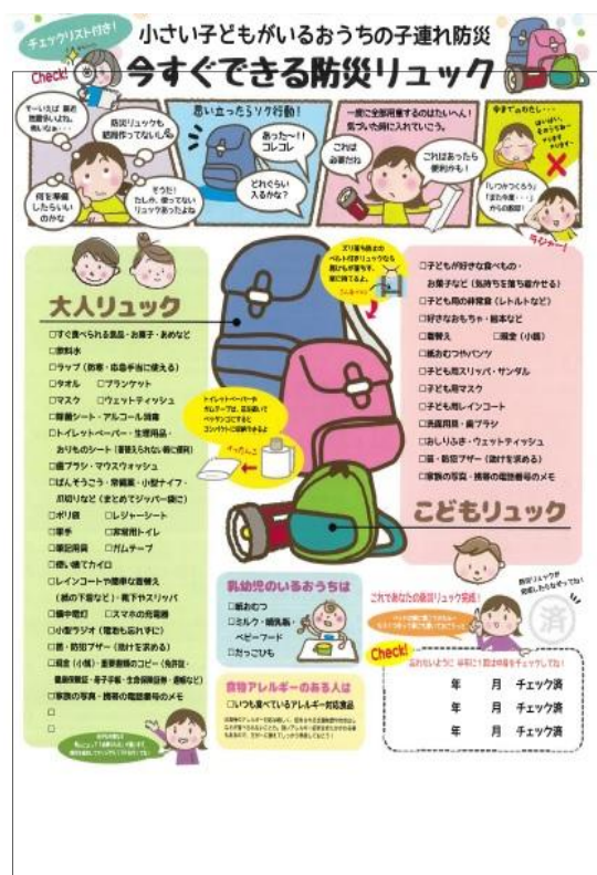
4 ページ目イメージ