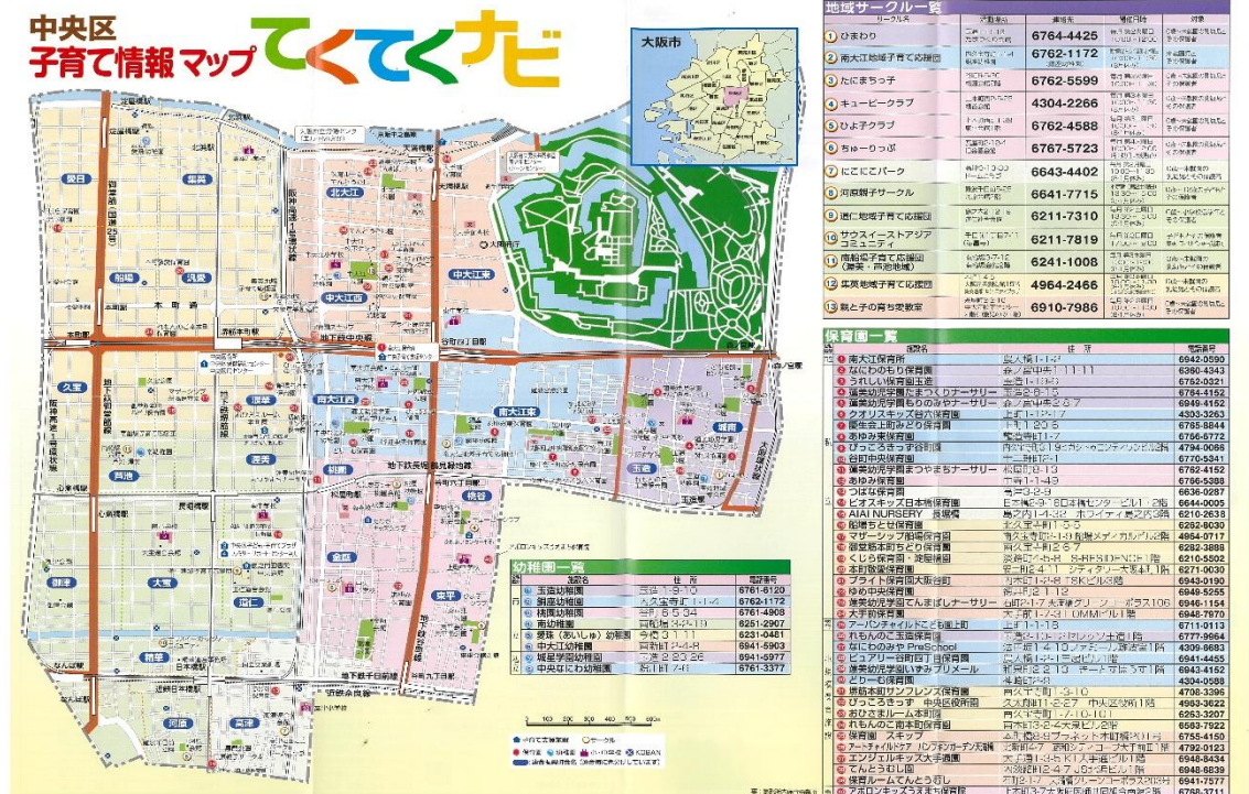
1 ページ目イメージ