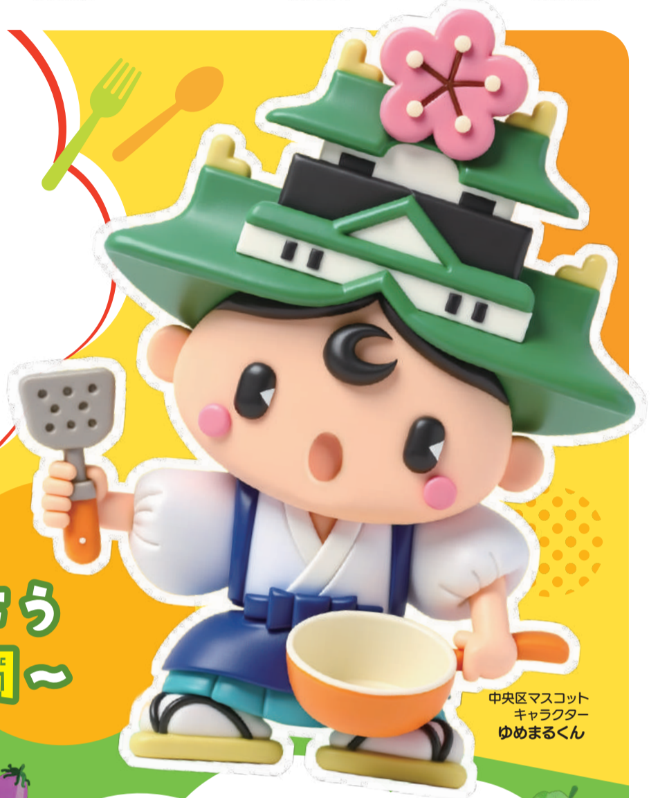
中央区マスコット キャラクター ゆめまるくん