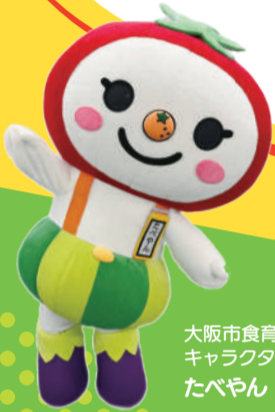
大阪市食育推進 キャラクター たべやん