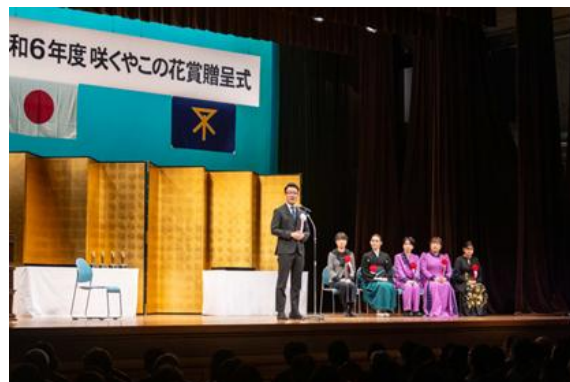
横山英幸大阪市長挨拶