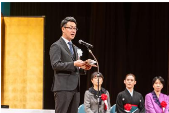
横山英幸大阪市長挨拶