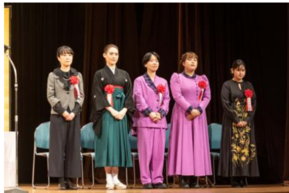
令和6年度咲くやこの花賞受賞者