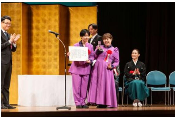
天才ピアニストさんへ賞状と記念トロフィーの贈呈