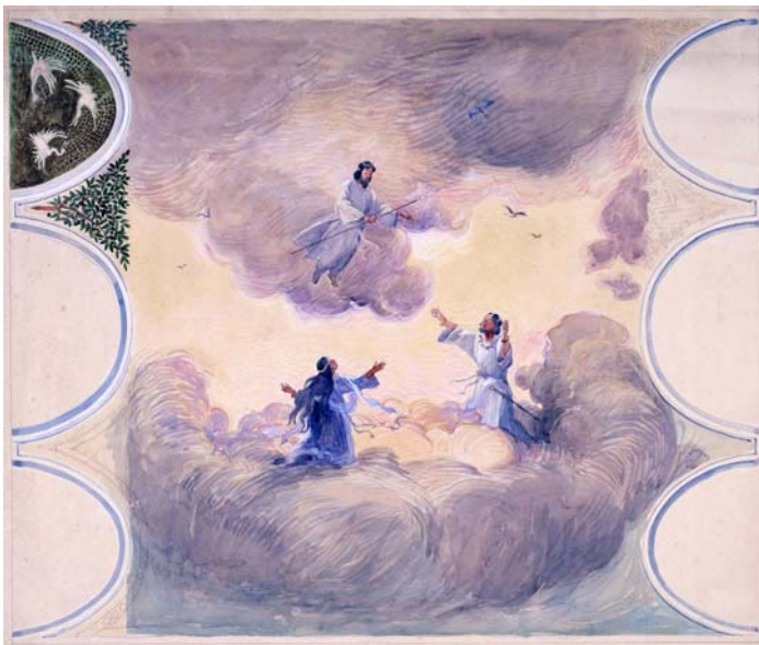
(2) 松岡壽画《天地開闢 下絵》 (大阪市立近代美術館建設準備室蔵)