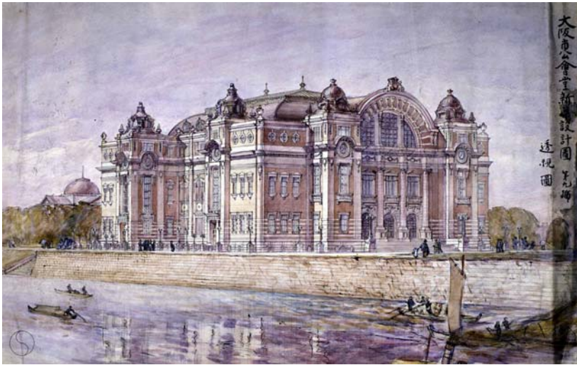
(1) 大阪市公会堂設計競技1席 岡田信一郎案透視図 (大阪市中央公会堂蔵)