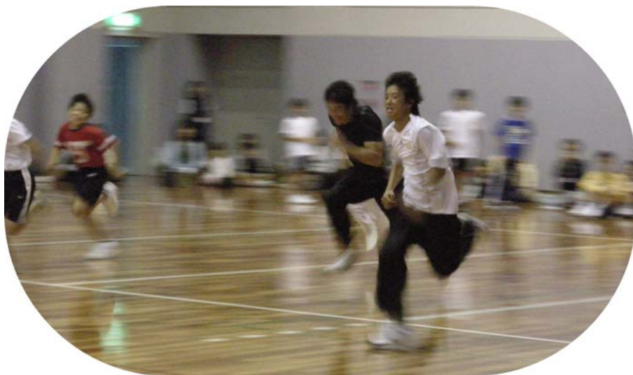
朝原選手と一緒に走るこどもたち (こども 夢・創造プロジェクト)