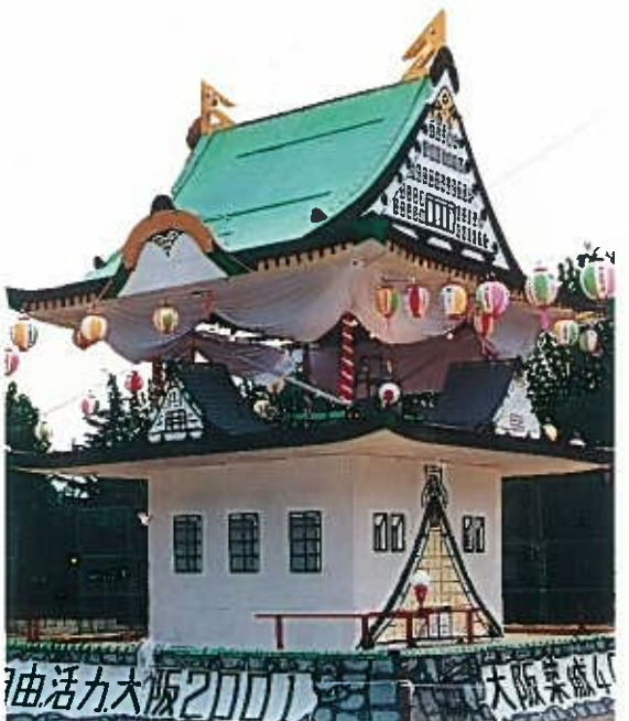
“大阪築城400年記念区民まつり” S58. 8. 6 主会場……中道小学校

“東成音頭作詞者 保田信雄氏の表彰” S52. 8. 5～6 主会場……片江小学校