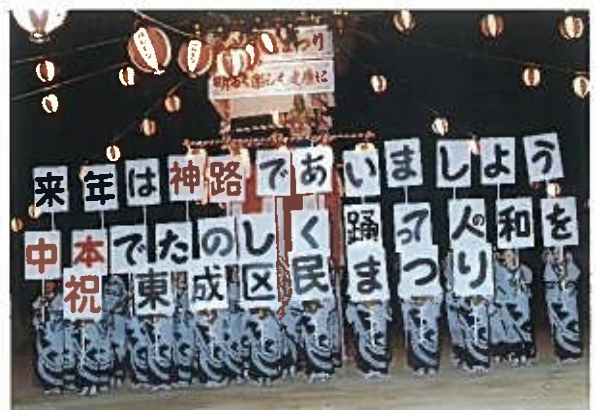
“校下婦人会のアイディアブラカード” S53. 8. 6 主会場……中本小学校