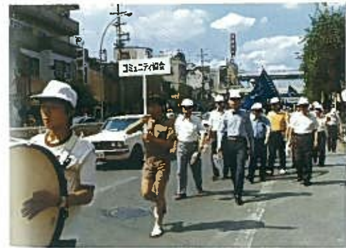
「東成区コミュニティ協会設立第一回目の区民まつり」