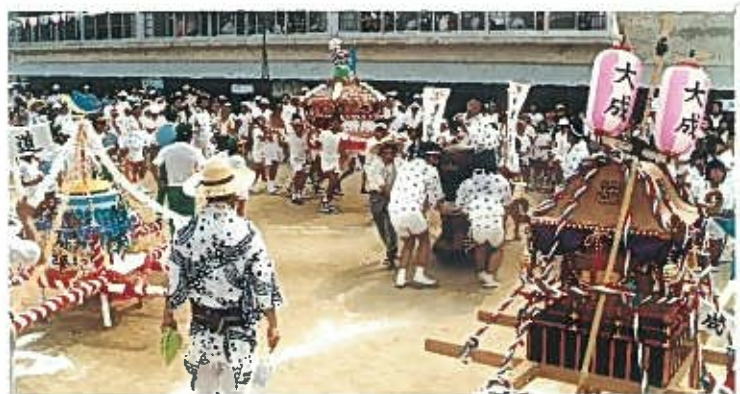
“校下子供みこし会場に集合” S54. 8. 4 主会場……神路小学校