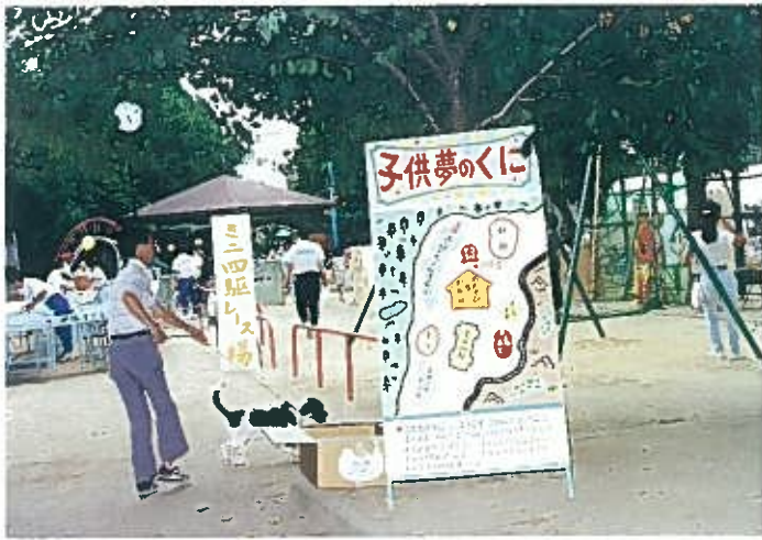
“子供夢の国オープン” H4. 8. 8 主会場……東中本公園