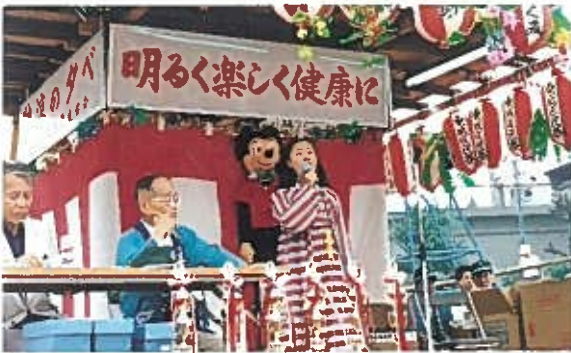
“のど自慢大会” S56. 8. 8 主会場……大成小学校