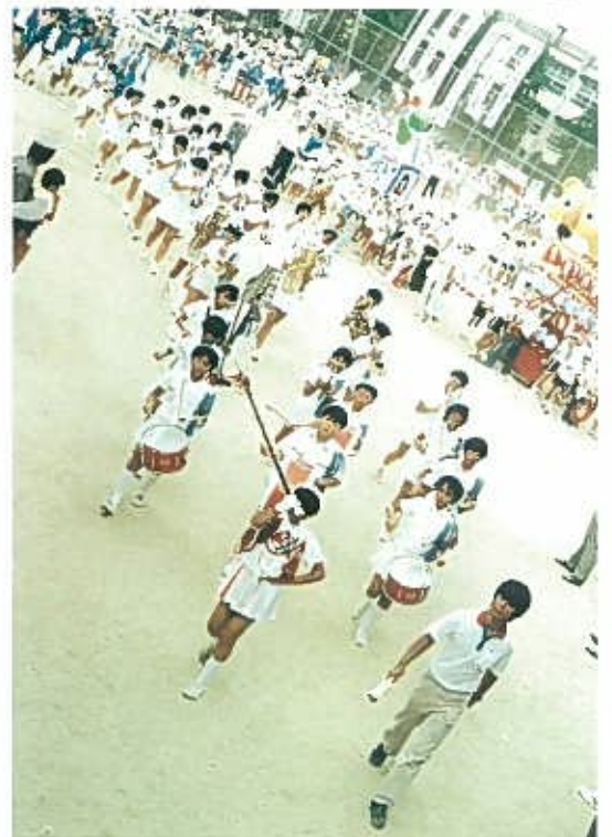
“神路ジュニアバンド入場” S61. 8. 3 主会場……東中本公園