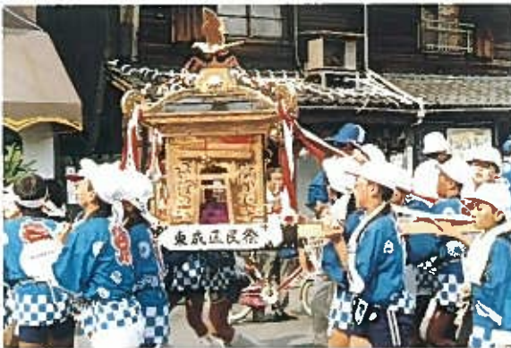
“区内パレード” S57. 8. 7 主会場……北中道小学校