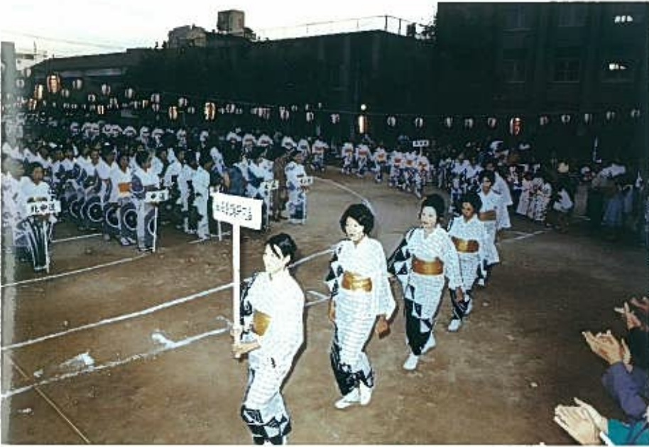
S49. 8. 8 主会場……東中本小学校