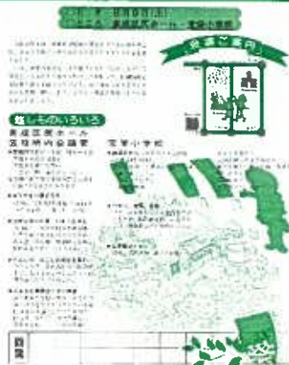
「区制50年記念のつどい」