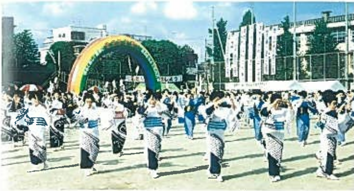
“婦人会民踊の輪” S62. 8. 2 主会場……東中本公園