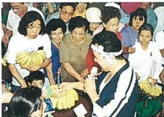
“バナナのたたき売り” H5. 8. 7 主会場……東中本公園