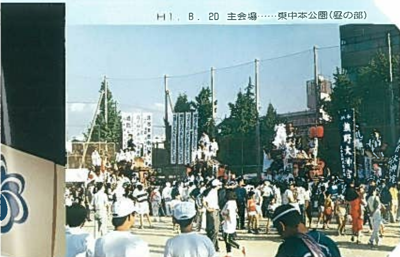
H1. 8. 20 主会場……東中本公園(昼の部)