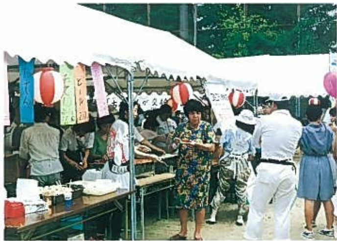
“各コーナー、模擬店大盛況” H3. 8. 3 主会場……東中本公園