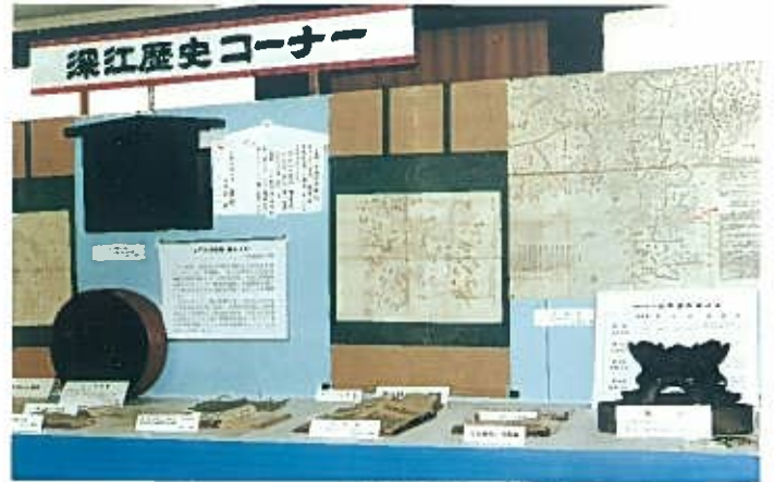
“深江民芸館—深江歴史コーナー” S59. 8. 12 主会場……深江小学校