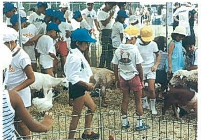
“可愛い動物のミニ動物園” S60. 8. 4 主会場……本庄中学校 東中本公園