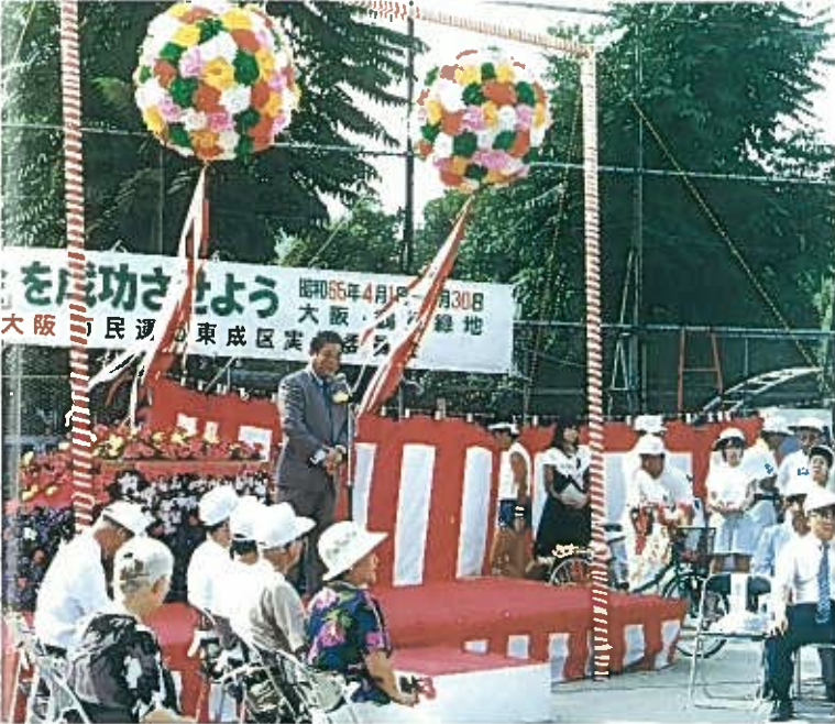
“区の花バラ・バンジー制定セレモニー” S63. 8. 7 主会場……東中本公園