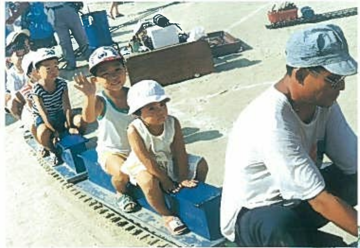
“ミニ蒸気機関車と子供達” H2. 8. 5 主会場……東中本公園