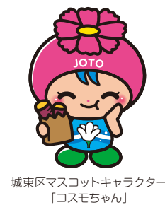
城東区マスコットキャラクター 「コスモちゃん」