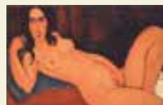
髪をほどいた横たわる裸婦 作家名:アメデオ・モディリアーニ 制作年:1917年

所蔵品など、詳しくはこちらをご覧ください▶ (Arttrip Museum 大阪新美術館コレクション)