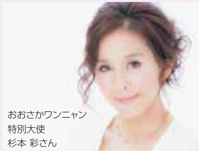
おおさかワンニャン 特別大使 杉本 彩さん

動物愛護に関する事業を支援する「大阪市動物愛護関連寄附金」を募集しています。詳しくは 画 をご覧ください。