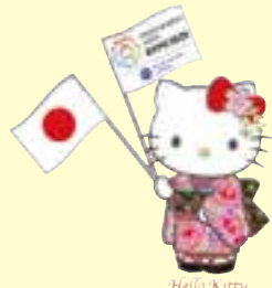
© 1976, 2018 SANRIO CO., LTD. APPROVAL NO. G590428