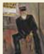
郵便配達夫 作家名:佐伯 祐三 制作年:1928年

新しい美術館では、大阪市ゆかりの画家・佐伯祐三やイタリア出身のモディリアーニ等による国内屈指の作品を所蔵しており、今後展示する予定です。