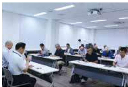
平成30年度 第1回 地域防災リーダー隊長会議 (研修会)の様子