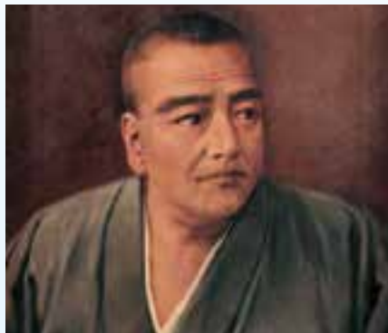
石川静正筆 西郷隆盛肖像画 個人蔵 鹿児島県歴史資料センター黎明館保管