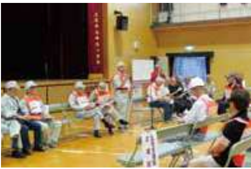
地域防災リーダー隊長が、地域で避難所開設訓 練を実施している様子