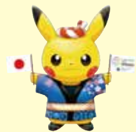
© 2018 Pokémon. © 1995-2018 Nintendo/Creatures Inc. /GAME FREAK Inc.

2025年の日本万国博覧会の実現に向け、ポケットモンスターおよびハローキティに、2025日本万国博覧会誘致委員会の「スペシャルサポーター」として、日本全国での機運醸成にご協力いただけることとなりました!