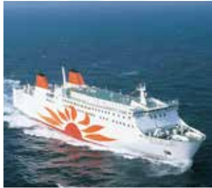
使用予定船舶 さんぷらわあ こぼると

大阪港に就航する大型フェリーで、明石海峡大橋を眺めながら、大阪湾をめぐるクルーズ。定員700人。小学生以下は保護者同伴。