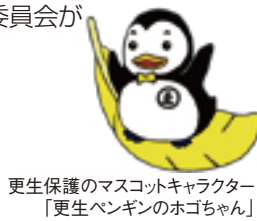
更生保護のマスコットキャラクター 「更生ペンギンのホゴちゃん」

城北川の遊歩道を利用している方々の安全を確保するためにサイレンと警告放送を行っています。