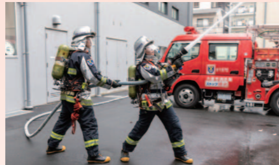
資器材が軽量化され、以前より扱いやすくなっています

ています。休みの日も、時間があれば筋トレやランニングに励みます。その成果があらわれたのか、通水状態のホースの重さは約70キロにもなりますが、以前より軽く感じるようになりました。