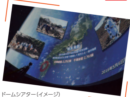
ドームシアター(イメージ)