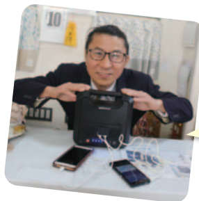
各浴場に 設置予定の 充電器です

問合せ／区役所総務課(総合企画) ☎6930-9937 FAX6932-0979