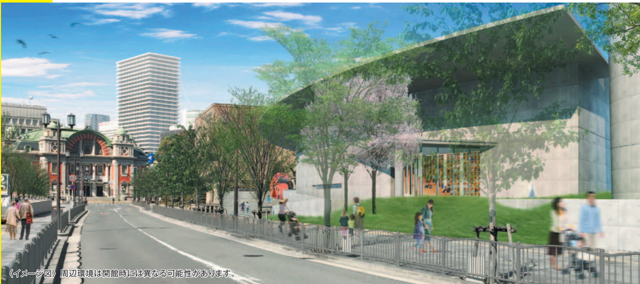
《イメージ図》周辺環境は開館時には異なる可能性があります。