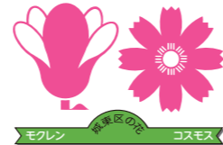
モクレン 城東区の花 コスモス