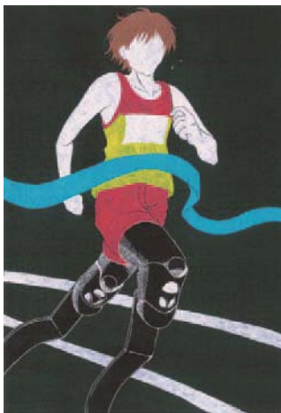
令和元年度 障がい者週間のポスター 中学生部門 最優秀賞作品

障がいのある人となない人との心のふれあいをテーマにした作文またはポスター。対象は市内在住または在学の①小学生以上②小・中学生。申込方法など詳しくはHPをご覧ください。 締 9/4 問 福祉局障がい福祉課 ☎6208-8072 FAX6202-6962