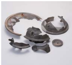
瀬戸内地域産の瓦質土器 江戸時代(19世紀) 広島藩大坂蔵屋敷跡 大阪市教育委員会蔵