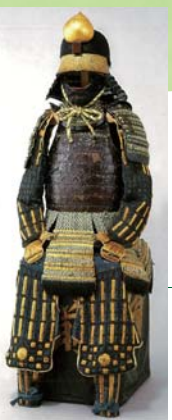
革包伊予札菱綴二枚胴具足 (伝 仙石秀久所用)