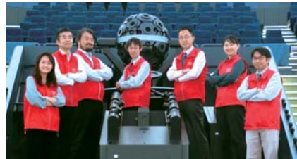
市立科学館 天文学芸員

流星、太陽、恒星、銀河・宇宙論、観測、歴史、気象など、各天文学芸員がそれぞれの個性・分野・時事に応じた内容で投影・解説します。定員各回95人(先着順)。