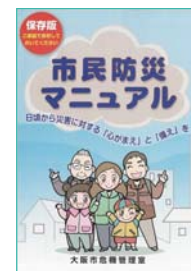
市民防災マニュアル