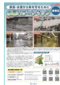
水害ハザードマップ