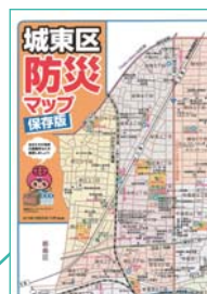
城東区防災マップ

お持ちでない方は 区役所 1 階総合案内 または区役所 3 階 33 番窓口まで