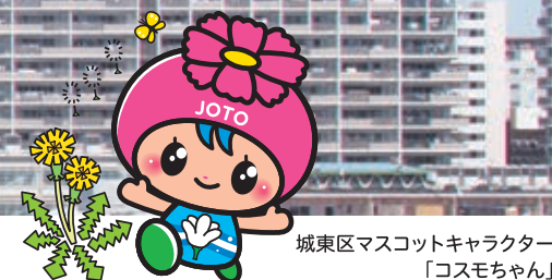
城東区マスコットキャラクター 「コスモちゃん」