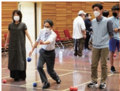
大東区長もボッチャに挑戦！