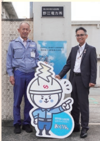
左から道端所長と大東区長