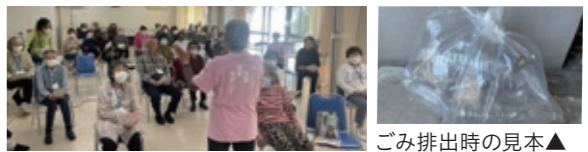
ごみ排出時の見本▲

問合せ：城東区まちづくりセンター (放出西1-9-7 放出西会館内) ☎ 6167-9900 FAX 6167-9901