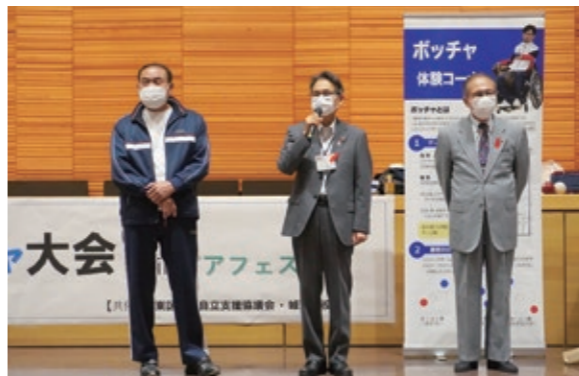
左から石原城東区地域自立支援協議会地域活動部会長、大東区長、高木城東区社会福祉協議会 会長

スギタクレストホールにて、城東区地域自立支援協議会の皆さまのご尽力により開催することができました。多くの方にご参加いただき、楽しくスポーツに親しむ素晴らしい一日となりました。