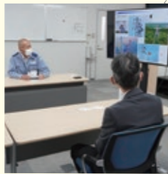
事業概要の説明を受けました