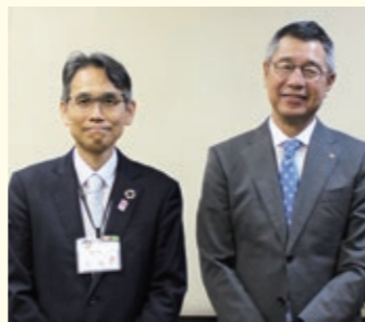
左から大東区長、大西社長