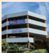
エディオン 京橋店駐車 場の4階・ 屋上部分 (蒲生1-9-10)