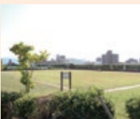
大阪市放出下水 処理場上部利用 施設屋外屋上 庭園 (「農園エリア」を除く) (永田2-3-61)

問合せ：市民協働課(防災・防犯) ☎6930-9045 FAX050-3535-8685