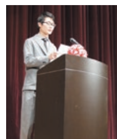
式典参加者を代表して「誓いのことば」