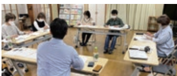
地域で行うInstagram講習会

皆さんも地域活動のチラシ等を目にしたときは、作り手の工夫や思いがあることを想像しながら見てみてください。