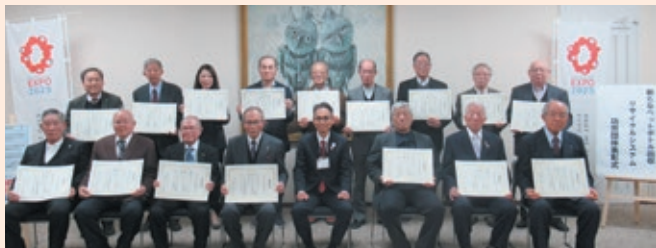
16地域活動協議会会長の皆さんと大東区長

各地域活動協議会がペットボトルを回収することでリサイクルの推進と、再資源化事業者への売却益を地域コミュニティへ還元し活力ある地域社会づくりに貢献されました。