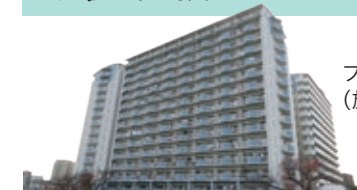
ファミリーハイイツ城東 (放出西1-2-51・59)