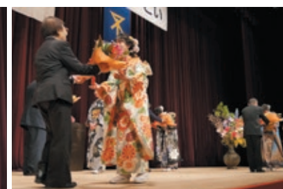
主催者よりお祝いの花束贈呈