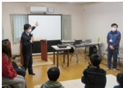
高田教授からの講義

※今福老人憩の家では、今福プログラミング教室を毎月第三日曜日(中高生が参加しプログラミングを開始)、ナレッジラボを毎週水曜日(スマホの操作や子どもの居場所づくりなど)に実施しています。