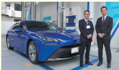
左から大東区長、笹川部長

説明の中で、脱炭素社会の実現に向けて水素事業に邁進していく、との力強い言葉をいただきました。区役所としても、区民の皆さんに広く知ってもらいたいとの思いとともに、大阪・関西万博を契機に、水素社会が身近になり、クリーンな社会が構築できることを願っています。