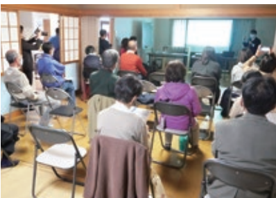
ロボット等のお話に興味津々の皆さん