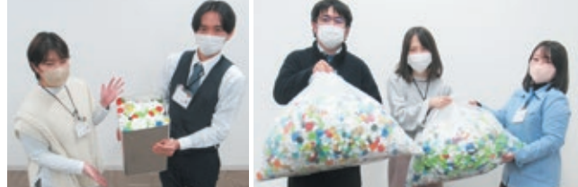
一斗缶いっぱいでもワクチン1本分です! 45Lのごみ袋2つ分も集まりました!