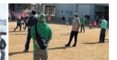
青指：子ども会ドッジボール大会のお手伝い