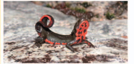
アカハライモリ

動物や植物、菌類、鉱物、人工毒など自然界に存在する毒について、動物学、植物学、地学、人類学、理工学の各研究分野のスペシャリストが解説します。