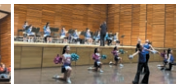
青福：ブルーリーフコンサート