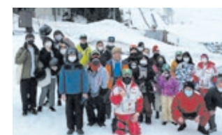
青指：雪国体験(野沢温泉)