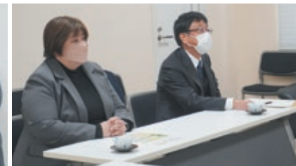
多岐にわたる話し合いが行われました