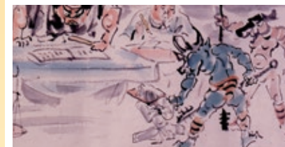
地こく変(部分) 菅橋彦筆 明治41年(1908) 大阪歴史博物館蔵