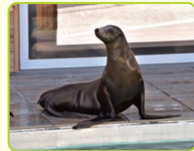
カリフォルニアアシカ