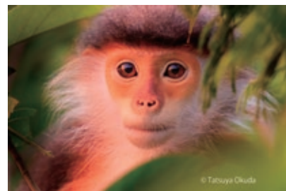
アカアシドゥクラングール

写真家の奥田達哉さんが東南アジアのジャングルで撮影した霊長類の絶滅危惧種の写真の中から、ユニークな約10種を20m以上にわたる壁面大型写真パネルで展示します。