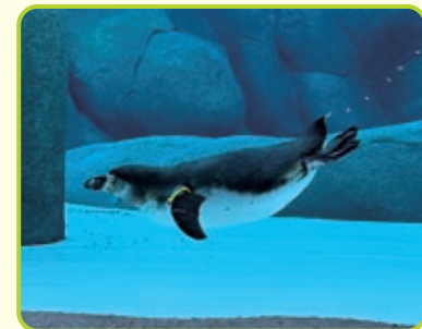
フンボルトペンギン