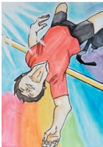
令和4年度 障がい者週間のポスター 小学生部門 最優秀賞作品

障がいのある人となない人との心のふれあいをテーマにした①作文または②ポスターを募集。対象は市内在住・在学の①小学生以上②小・中学生。申込方法など詳しくは HP をご覧ください。