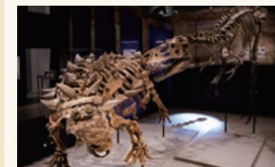
ズール(左)とゴルゴサウルス(右)の対峙シーンを再現した全身復元骨格 東京会場

よろいゆう 鎧竜史上最高の完全度とうたわれるズール・フルリヴァスタトルの実物化石を中心に、身を守るためにトゲやプレートを進化させた装盾類の進化について解説。「攻・守」をキーワードに恐竜たちの進化を読み解きます。