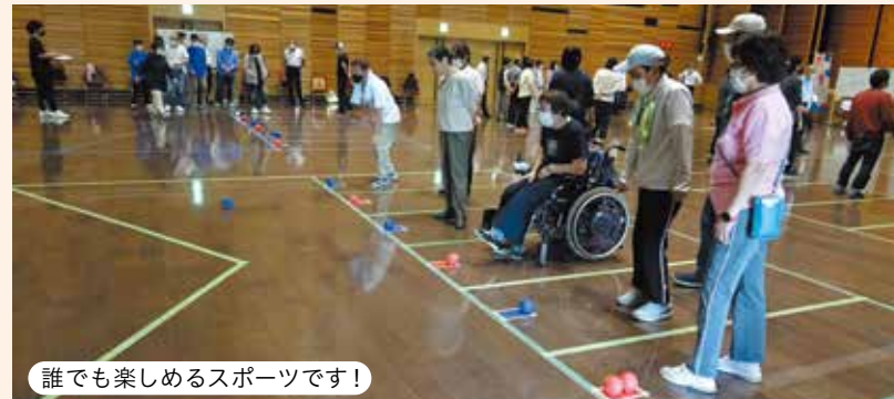
誰でも楽しめるスポーツです！