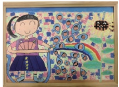
令和4年度 特選賞(2年生)