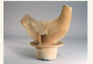
鳥形埴輪 古墳時代 大阪歴史博物館蔵