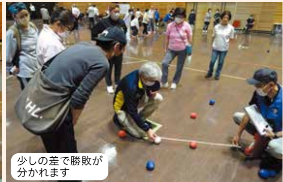
少しの差で勝敗が分かります

ボッチャとは・・・年齢、性別、障がいのあるなしにかかわらず、すべての人が一緒に競い合えるスポーツです。ジャックボール(目標球)と呼ばれる白いボールに、赤・青のそれぞれ6球ずつのボールを投げたり、転がしたり、他のボールに当てたりして、いかに近づけるかを競います。