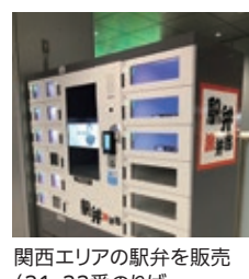
関西エリアの駅弁を販売 (21・22番のりば エスカレーターそば)