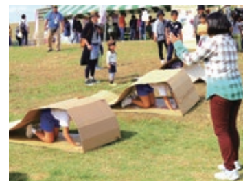
ダンボールキャタピラー