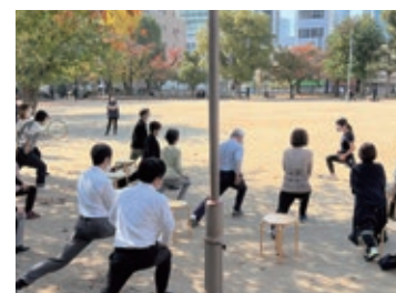
お昼休み☆20分ゆるゆるストレッチ