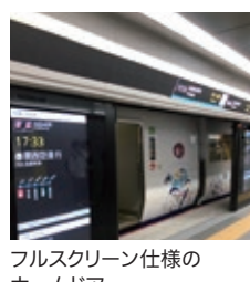
フルスクリーン仕様の ホームドア