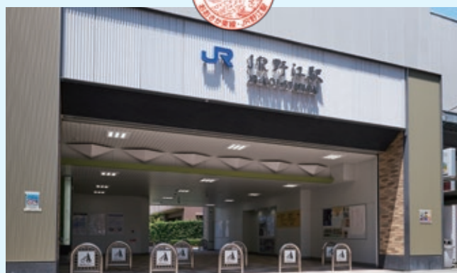
駅名表示は行書体で能舞台を表現した駅舎

2019年3月16日に開業した、おおさか東線新駅のひとつです。駅名はわかりやすく所在地の町名にし、JRを冠しているのは京阪本線の野江駅と区別するためです。また、駅舎のコンセプトは「榎並猿楽」。野江地域が、能のルーツのひとつである榎並猿楽の発祥地であることにちなんでいます。