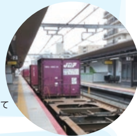
JR野江駅2番線ホームにて

おおさか東線の開業前は、城東貨物線と呼ばれる貨物輸送の線路でした。鉄道ネットワークをより充実させるため、旅客路線として整備されました。現在でも貨物列車の運行は続けられています。