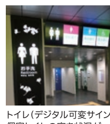
トイレ(デジタル可変サイン: 個室トイレの空き状況が モニター表示)