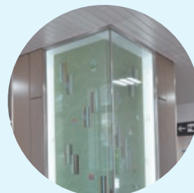
猿楽の衣装を表現した モニュメント

2019年3月16日に開業した、おおさか東線新駅のひとつです。駅名はわかりやすく所在地の町名にし、JRを冠しているのは京阪本線の野江駅と区別するためです。また、駅舎のコンセプトは「榎並猿楽」。野江地域が、能のルーツのひとつである榎並猿楽の発祥地であることにちなんでいます。