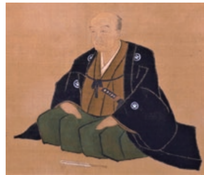
近松門左衛門像(部分)江戸時代(18世紀) 大阪歴史博物館蔵