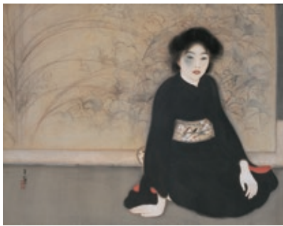
島成園《無題》大正7年(1918) 大阪市立美術館【通期展示】

しませいえん ちくさ 島成園や木谷千種など50人を超える近代大阪の女性日本画家の活動を、約150点の作品と関連資料で紹介。画家として社会的な成功を夢見た女性たちを育んだ、大阪の文化的な土壌について考えてみませんか。