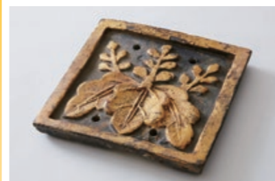
金箔桐文方形飾瓦 大阪市指定文化財 豊臣時代 大阪歴史博物館保管

豊臣秀吉が造った大坂城を象徴する金箔瓦や武家屋敷の屋根を飾った家紋瓦などの発掘資料を展示し、大坂城と城下町の姿を紹介します。