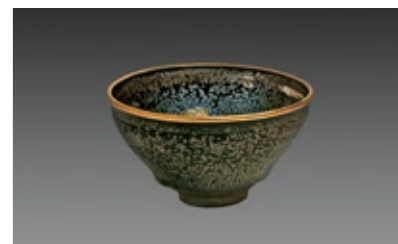
国宝 油滴天目茶碗 南宋時代・12-13世紀 建築 大阪市立東洋陶磁美術館 (住友グループ寄贈/安宅コレクション)