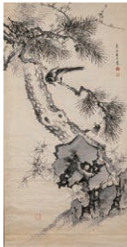
松竹梅鳥図 藪長水 個人蔵

京阪で活躍した絵師や書家の手による掛軸など、江戸時代が終わりへと向かう動乱期に、大阪の芸術文化を支え続けた商家・浅野家秘蔵のコレクションを紹介します。