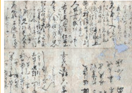
京都から大坂落城の火災を目撃したと語る書状の写し (大阪城天守閣蔵)

戦国最大の合戦・大坂の陣。同時代史料に見る「実録」と、長い年月の間に浸透した「創作」で、決戦から410年経った今もなお、私たちを魅了する虚実の逸話を紹介します。