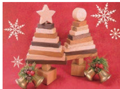
木工作品イメージ

吹きガラス・陶芸・織物・木工・金工など10種類の本格的な工芸体験ができる体験教室。定員2～12人(先着順)。空きがあれば当日参加もできます。各教室の対象年齢や費用など、詳しくは HP をご覧ください。