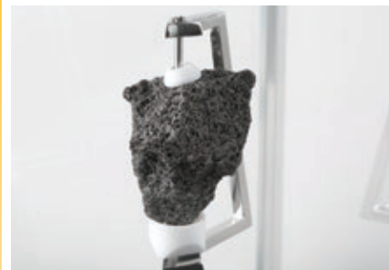
月の石(アポロ15号採取)

1970年の大阪万博で人々が夢見た体験を、当時の記録映像や万博関連資料とともに紹介。前期は万博で使用されたものと同機種の大型コンピュータなど、後期はNASA所蔵の「月の石」の実物や宇宙服などを展示します。