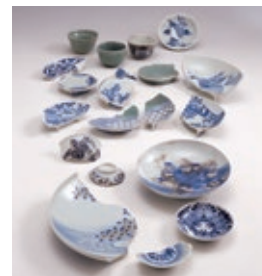
鍋島 江戸時代中期頃(17世紀末～18世紀前半) 佐賀藩蔵屋敷跡(北区)

大阪が天下の台所として栄えた江戸時代、年貢米や特産品を販売するために各地の藩が中之島とその周辺に構えた蔵屋敷について、発掘調査成果を中心に展示します。