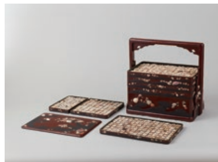
木村兼葎堂貝石標本(大阪府指定有形文化財)

本草書から初期の図鑑、歴史的な発見をもたらした実物標本、最新の研究技術までを一堂に集め、江戸時代から現代までの貝類学の研究史とその成果をひもときます。