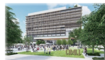
森之宮キャンパスの完成予定イメージ