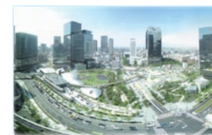
うめきた2期区域のまちづくり