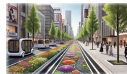
御堂筋 みちの未来体験EXPOイメージ