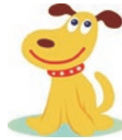
大阪市消費者センター メインキャラクター エルちゃん

「スマホでSNSや動画の広告を見て、サブメントを1回だけのつもりで購入したが、定期購入契約になっていた」などのトラブルが増えています。困ったら、気軽にご相談ください。消費生活相談は市内在住の方に限り、☎・面談(事前予約制)・☑で行っています。