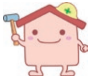
大阪市耐震診断・改修 広報担当キャラクター たいしんくん

民間戸建住宅や共同住宅などの耐震診断・耐震改修の費用、また、耐震性が不足している民間戸建住宅などの除却(解体)の費用を一部補助します。詳しくはHPをご覧ください。