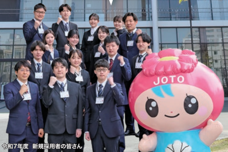
令和7年度 新規採用者の皆さん

城東区では 人が輝き活気にあふれ、愛着がある 「住んでよかったと思えるまち」を めざしています