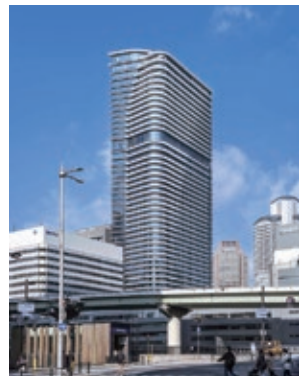
第37回大阪市ハウジングデザイン賞 受賞住宅 Brillia Tower 堂島

魅力ある良質な集合住宅を表彰する「大阪市ハウジングデザイン賞」を実施。推薦いただいた方の中から抽選で50人に図書カード(500円分)をプレゼント。