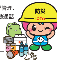
城東区マスコットキャラクター「コスモちゃん」

防犯カメラの計画的な再設置および管理、特殊詐欺被害防止の啓発および自動通話録音機貸与事業の強化など