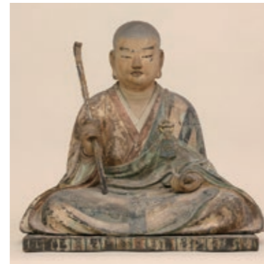
重要文化財 木造僧形八幡神像 正平8年～9年(1353～1354) 壺井八幡宮蔵

源義家や源頼朝、足利尊氏らを輩出し、武士の世の礎を築いた河内源氏一族と、彼らの守護神として長らく武家の崇敬を受けた壺井八幡宮の歴史を紹介します。