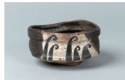
黒織部波文茶碗 松恵コレクション 桃山時代(17世紀) 美濃窯

初公開の茶道具を中心とした「松恵コレクション」や、中国陶磁の酒器を中心とした「入江正信コレクション」などを、オムニバス方式で紹介します。