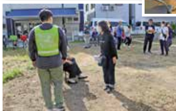
認知症の方への対応方法を学ぶ講座や声かけ訓練の開催