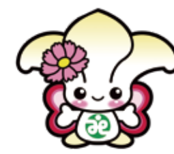
城東区社会福祉協議会 マスコットキャラクター「じょたん」