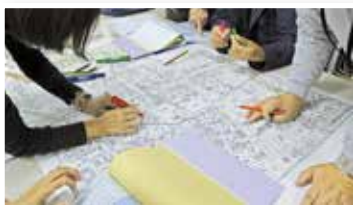
見守り活動に関する情報交換会の開催