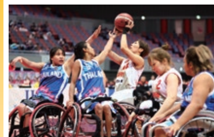
過去大会の様子(日本vsタイ)

オーストラリア、ドイツ、タイ、日本の各国代表チームによる迫力のある試合を、会場で観戦しませんか。