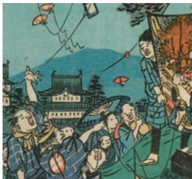
錦絵「花暦浪花自慢」より 行楽客でにぎわう幕末の大坂城(大阪城天守閣蔵)

大坂の陣や幕末維新期の内戦など、幾度もの戦災に見舞われながらも、大阪の町の発展を支え、今日の平和な姿へと歩んできた大阪城。その歩みを、貴重な資料を通じて紹介します。