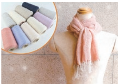
織物作品イメージ

吹きガラス・陶芸・織物・木工・金工など9種類の本格的な工芸体験ができる体験教室。空きがあれば当日参加もできます。各教室の対象年齢や費用など、詳しくはHPをご覧ください。