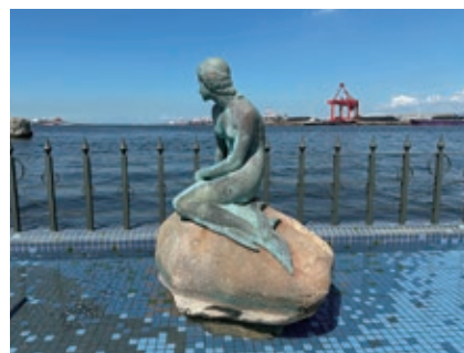
大阪ベイエリア（マーメイド像）

八幡屋公園を出発し、大阪港が一望できるベイエリアを街歩き。ロングコースでは渡船を利用して港区・大正区をめぐる。小学生以下は保護者同伴。第三者のサポートが必要な方は介助者同伴。