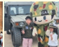
蒲生公園会場(車両展示)

問合せ：市民協働課(防災・防犯) ☎ 06-6930-9045 FAX 050-3535-8685