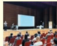
城東スギタクレストホール 会場(講演)