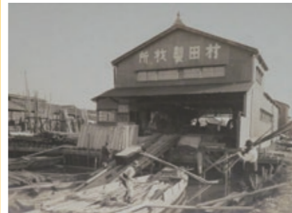
村田製材所(写真展示) 大正期 大阪歴史博物館蔵

鉄工所や製材所、硝子加工所など、大阪ゆかりの町工場に関する大正時代から昭和時代までの資料を中心に展示。現在のくらしに身近なもののづくりの歴史を紹介します。