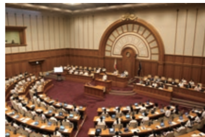
昨年の様子(市会議場で開催)

議員になって、市長に質問や提案をしてみませんか。対象は市内在住または在学の小学5・6年生。定員81人。