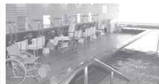
大浴室(リフト付き)