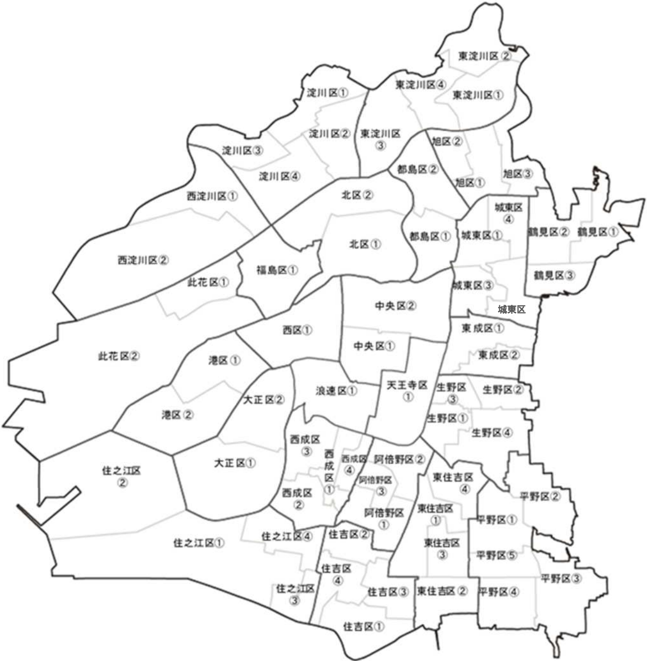
図6-3-1 大阪市における日常生活圏域