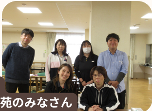
チーム おがわ苑のみなさん