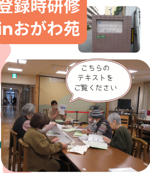
こちらのテキストをご覧ください

研修も活動も いつもの施設の中で いつもの施設で登録時研修を受け、そのままポイント活動に参加できる新しいスタイルが始まっています。施設の職員さんとの連携もしやすく、安心して活動を続けていただけます。 また、施設に入居されている方が、同じ敷地内の別の施設でクラブ活動として参加されるケースや、これまでボランティアとして関わっていた方が、活動先の施設で研修を受けて『活動者』として活動を始められるケースも広がっています。 無理なく続けられる新しい参加の形として、今後の広がりが楽しみな取り組みです。