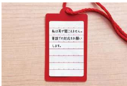
▲ 裏面にシールを貼り、必要な情報を記載することができます。