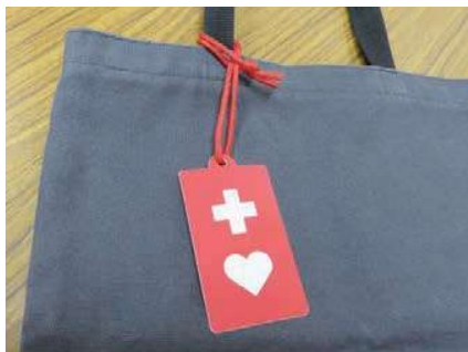
▲ 鞆等につけることができます。