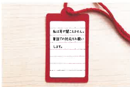
▲ 裏面にシールを貼り、必要な情報を記載することができます。