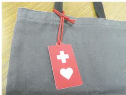
▲ 鞆等につけることができます。