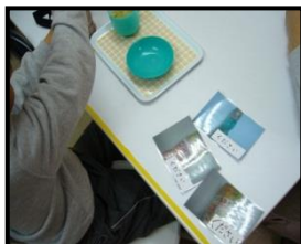
コミュニケーション (おやつ場面)