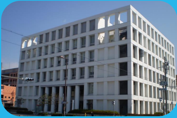
大阪市社会福祉研修・情報センター (運営主体:大阪市社会福祉協議会)